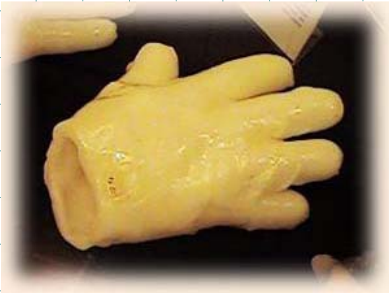
Molde em parafina